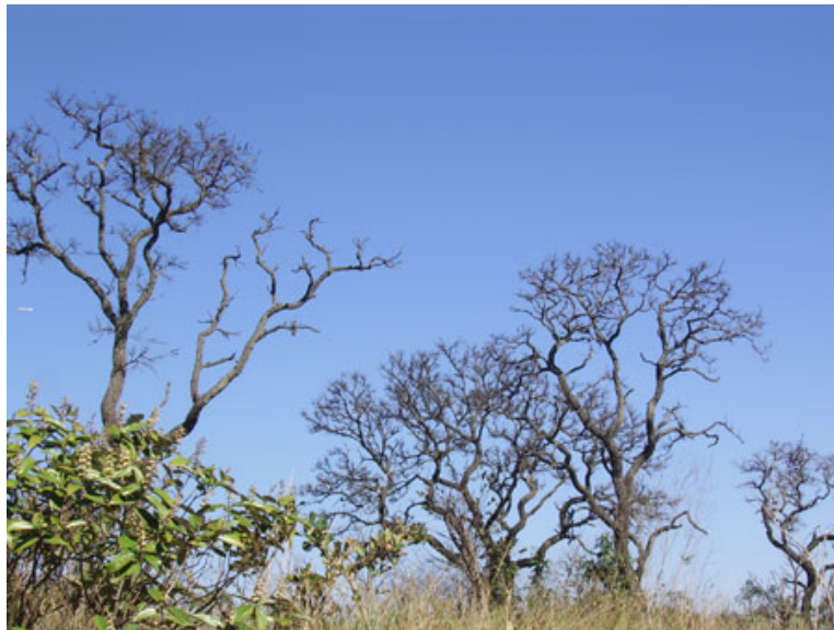
Figura 6.5: As árvores típicas do Cerrado na região da Grande São Paulo.

Para sobreviver à estação mais seca, as plantas do Cerrado possuem adaptações, como os caules tortuosos, troncos com casca grossa e extensas raízes, que podem chegar a mais de 20 metros de profundidade! Por isso, também se diz que o Cerrado é como uma “floresta invertida” (já que as árvores não são altas, mas possuem raízes profundas, ao contrário das árvores das florestas tropicais).