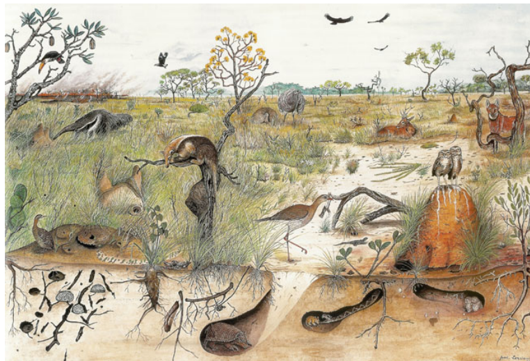
Figura 6.3: Esquema do Cerrado com alguns exemplares da fauna e flora características.