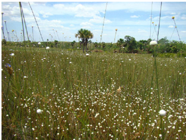
Figura 6.6: As veredas, áreas permanentemente alagadas do Cerrado, com presença da palmeira buriti ( Mauritia flexuosa ) e do capim-dourado ( Syngonanthus nitens ), na região do Jalapão (Tocantins).